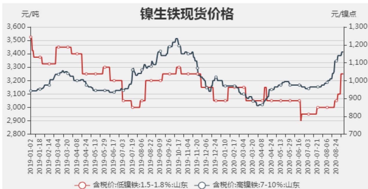
图1：镍生铁现货价格

截止至2020年09月04日，以山东地区为例，低镍铁（FeNi1.5-1.8）价格为3250元/吨，较上周增加150元/吨，高镍生铁（FeNi7-10）价格为1160元/镍点，较上周上涨20元/镍。