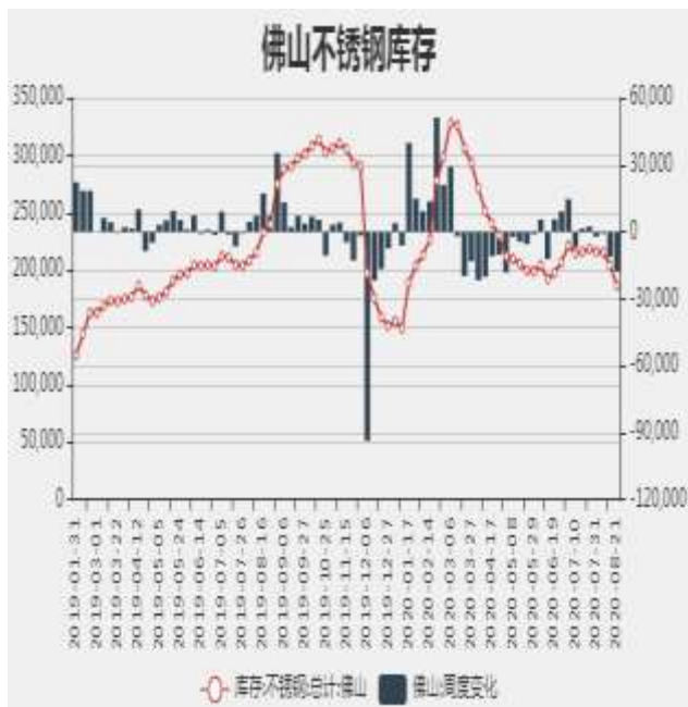
图7：佛山不锈钢月度库存