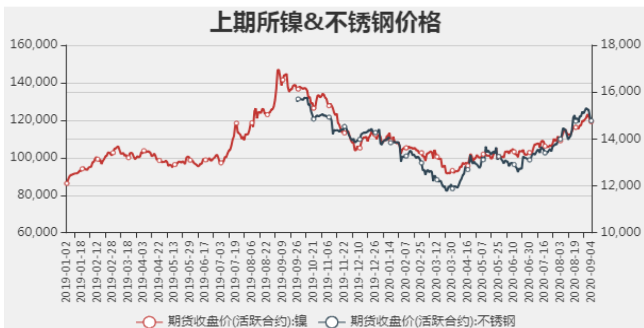
图2：国内镍现货价格

截止至2020年09月04日，沪镍期货价格为119250元/吨，不锈钢期货价格为14775元/吨。