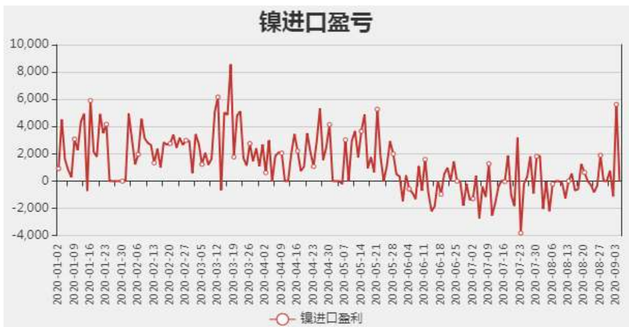
图5：镍进口盈亏分析

截止至2020年08月28日，全国主要港口统计镍矿库存为713.74万吨，较上周减少6.98万吨。截止至09月03日，菲律宾镍矿:Ni:1.5-1.6Fe:25-30%:华东价格为572元/吨。