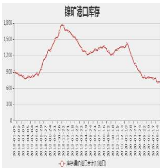
图3：国内镍矿港口库存