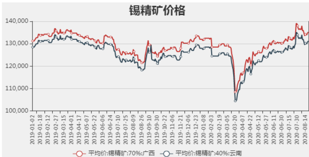
图2：国内锡精矿价格

截止至2020年08月20日，国内广西锡精矿70%价格为135250元/吨，云南锡精矿40%价格为131250元/吨。