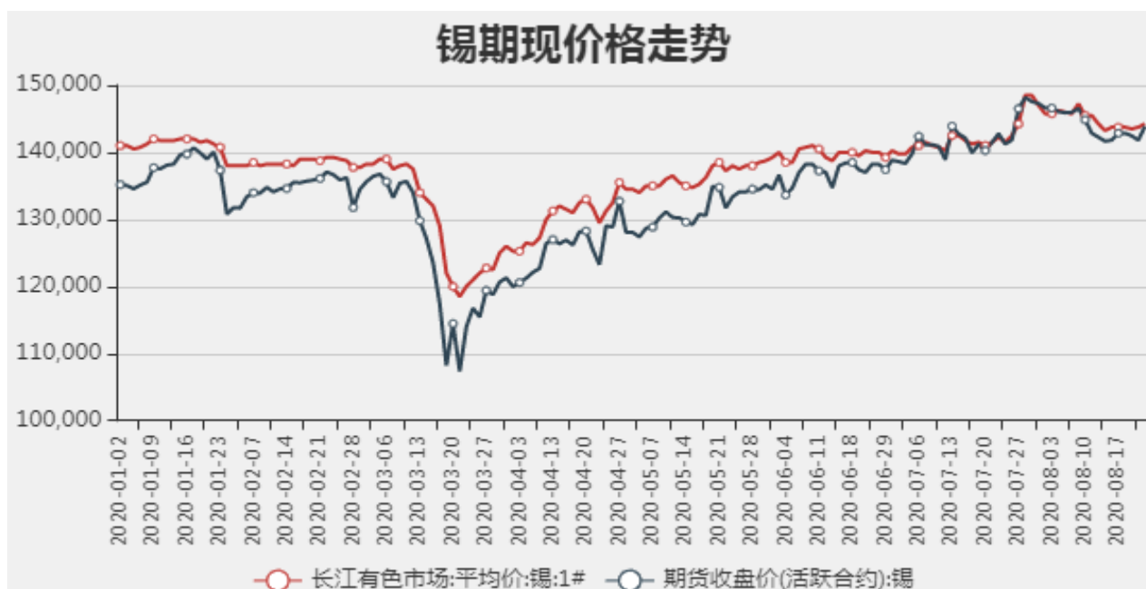
图1：国内锡现货价格

截止至2020年08月21日，长江有色市场1#锡平均价为144250元/吨，沪锡期货价格为143870元/吨。