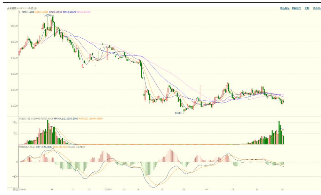
合成橡胶期货主力合约价格走势