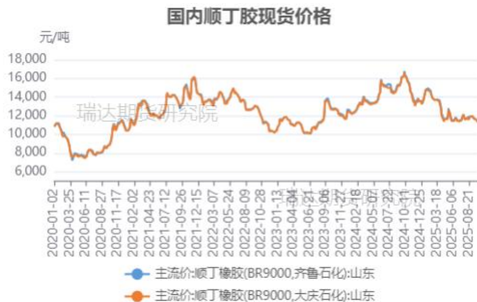
顺丁橡胶现货市场价格走势