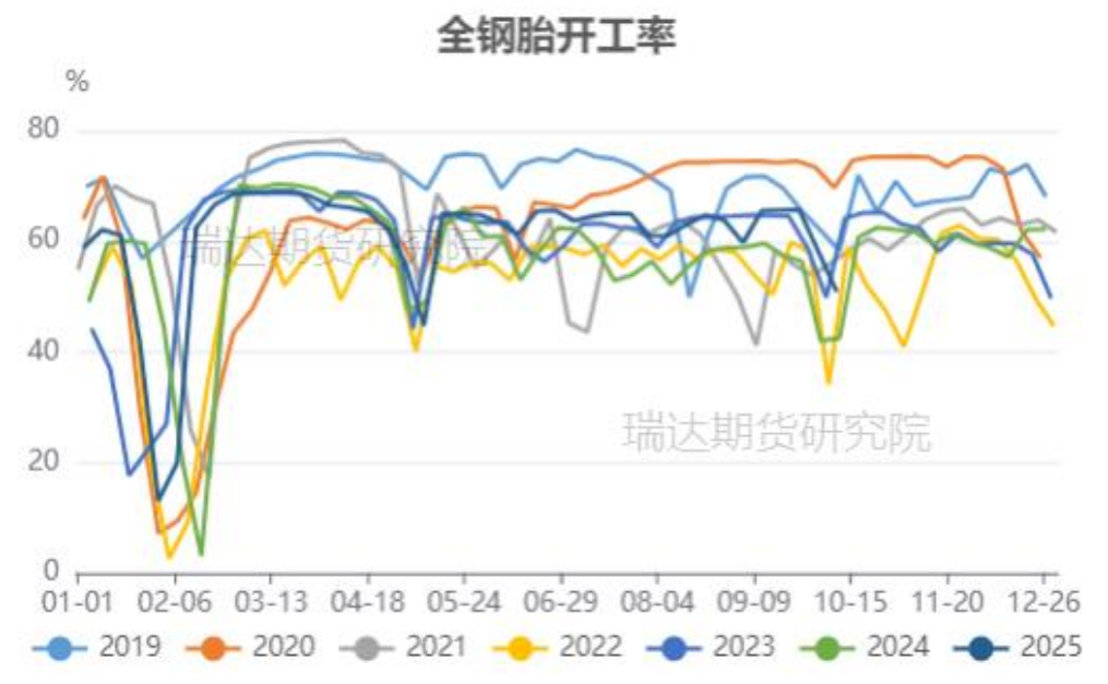
国内全钢胎开工率