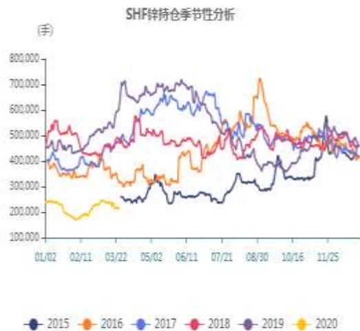
图5：沪锌季节性持仓走势图