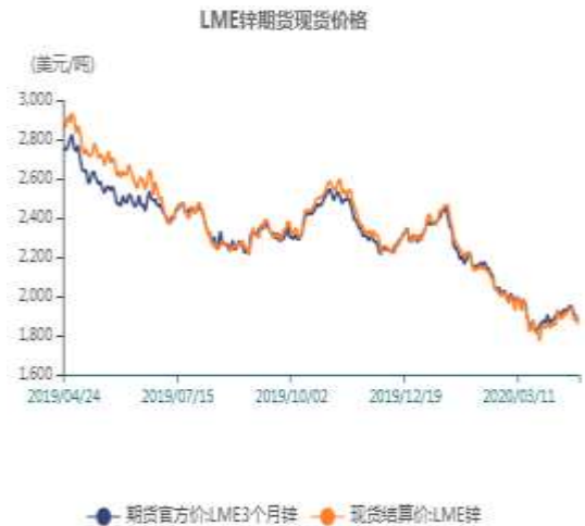
图9、LME锌现货价格走势

截止至2020年04月23日，LME3个月锌期货价格为1874.5美元/吨，LME锌现货结算价为1855美元/吨。