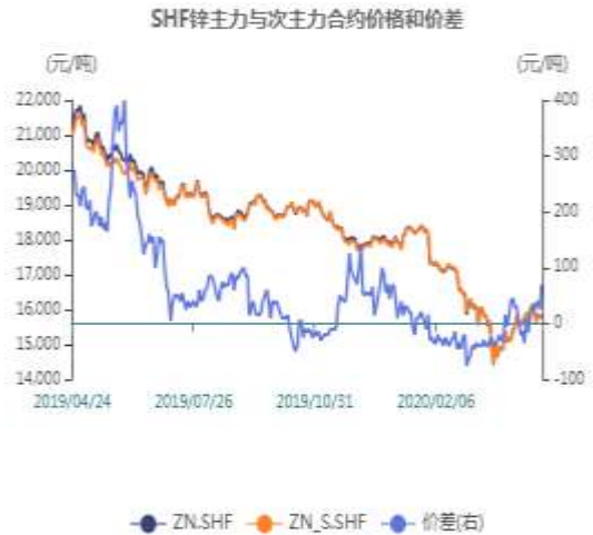
图6：沪锌主力与次主力价差走势图