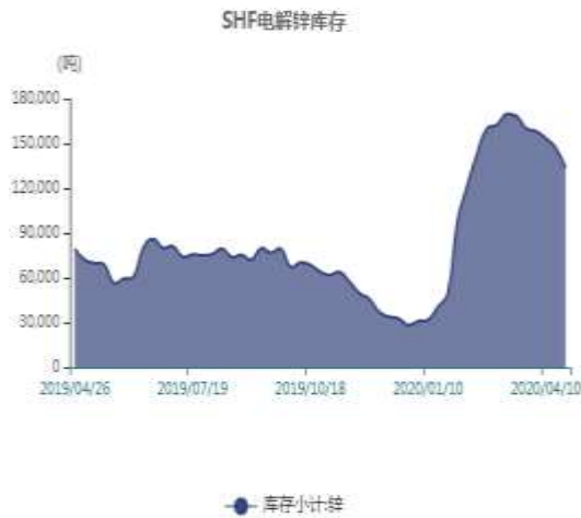
图13：上海锌库存走势图

截止至2020年04月24日，上海期货交易所精炼锌库存为133349吨，较上一周减少13617吨。