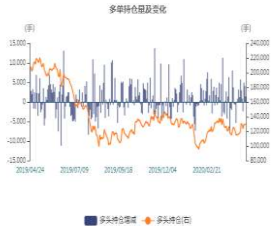
图2：沪锌多头持仓走势图