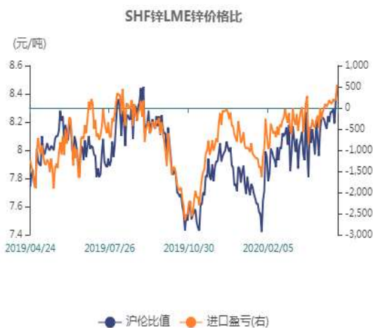
图1：锌两市比值走势图