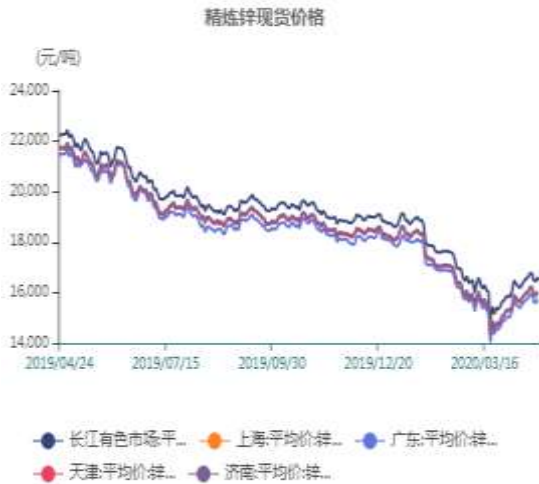
图8、国内锌锭价格走势

截止至2020年04月24日，长江有色市场0#锌平均价为16500元/吨，较上一交易日减少100元/吨；上海、广东、天津、济南四地现货价格分别为16060元/吨、15760元/吨、16000元/吨、16050元/吨。