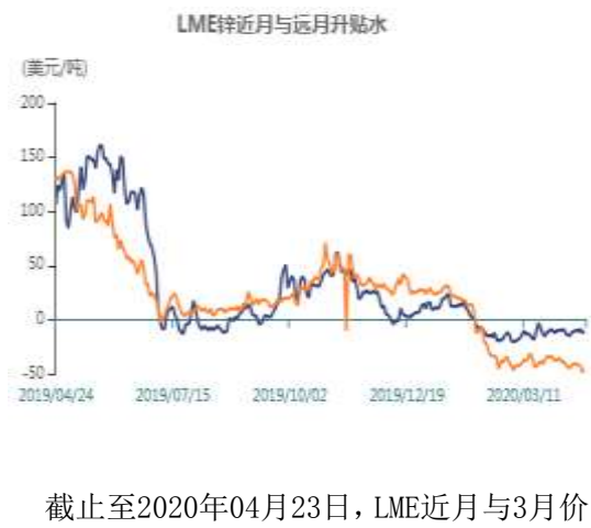
图11：LME锌现货升水走势图

截止至2020年04月23日，LME近月与3月价差报价为-11.25美元/吨，3月与15月价差报价为贴水47.5美元/吨。