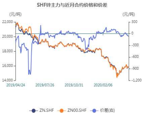
图7：沪锌近月与远月价差走势图