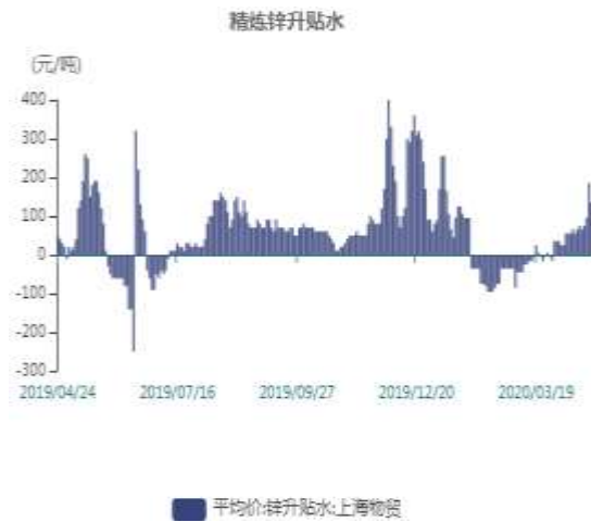
图10：上海精炼锌贴水走势图

截止至2020年04月23日，LME3个月锌期货价格为1874.5美元/吨，LME锌现货结算价为1855美元/吨。