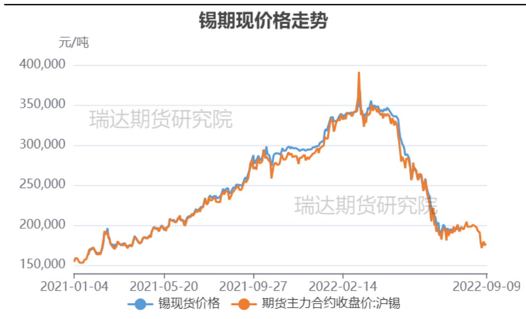
图1、锡期现价格走势