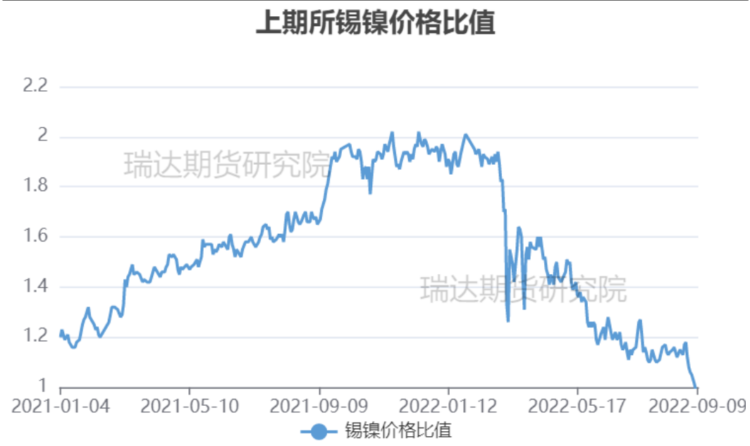
图3、沪锡和沪镍主力合约价格比率