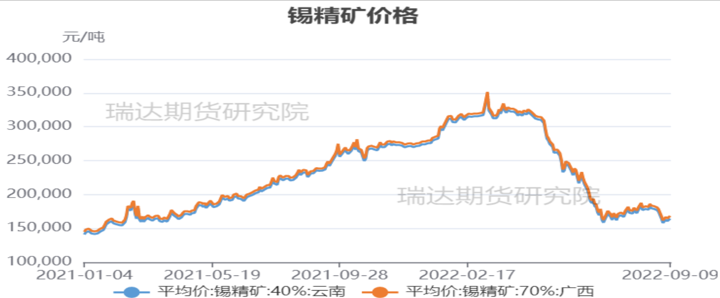
图7、国内锡矿价格走势