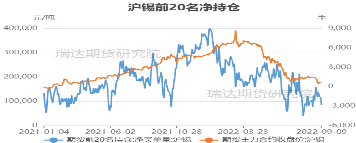
图6、前二十名持仓量