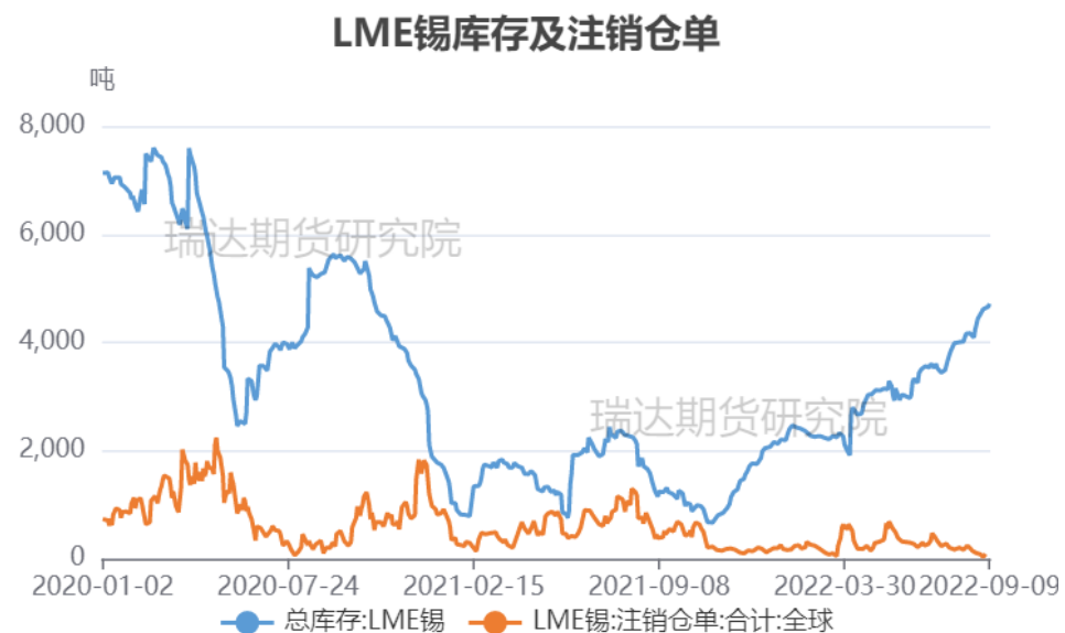
图9、LME锡库存与注销仓单