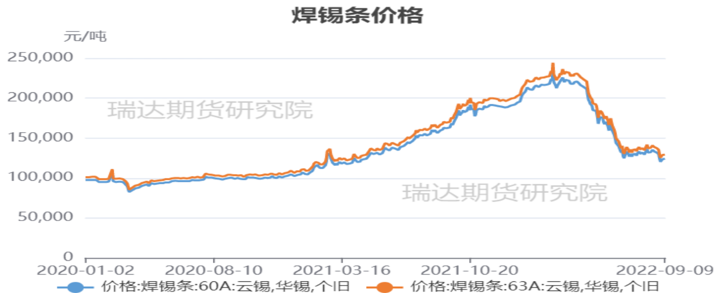
图11、锡焊条价格走势