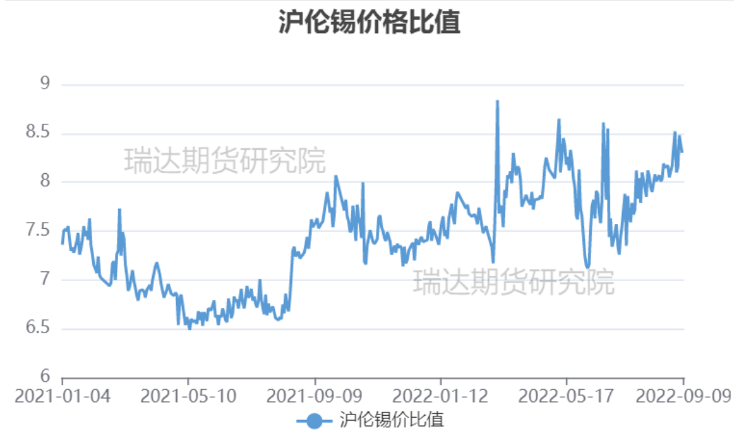
图4、沪伦锡价格比率