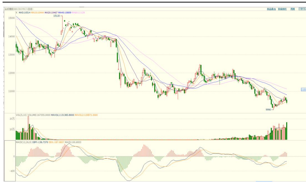
合成橡胶期货主力合约价格走势