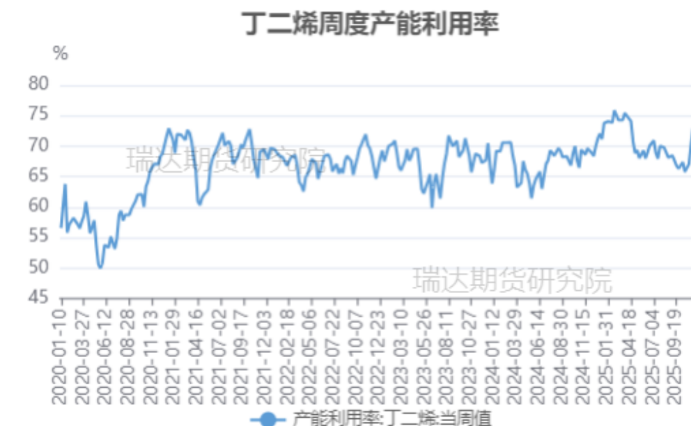
丁二烯周度产能利用率