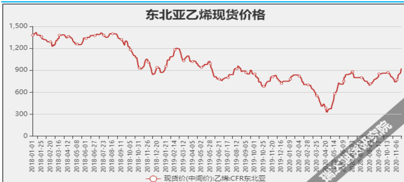
图13 东北亚乙烯现货价

截至12月16日当周，内陆地区部分甲醇代表性企业库存量35.13万吨，较上周-0.59万吨。