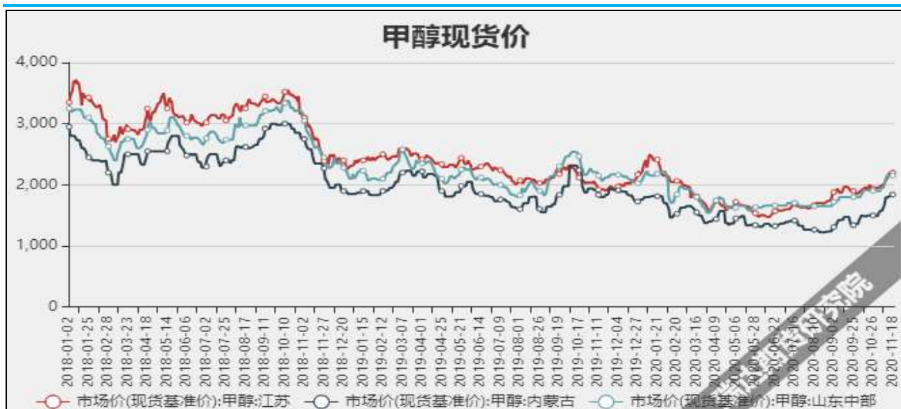
图3 甲醇现货市场主流价

截至12月17日, NYMEX天然气收盘价2.65美元/百万英热单位, 较上周+0.08美元/百万英热单位。