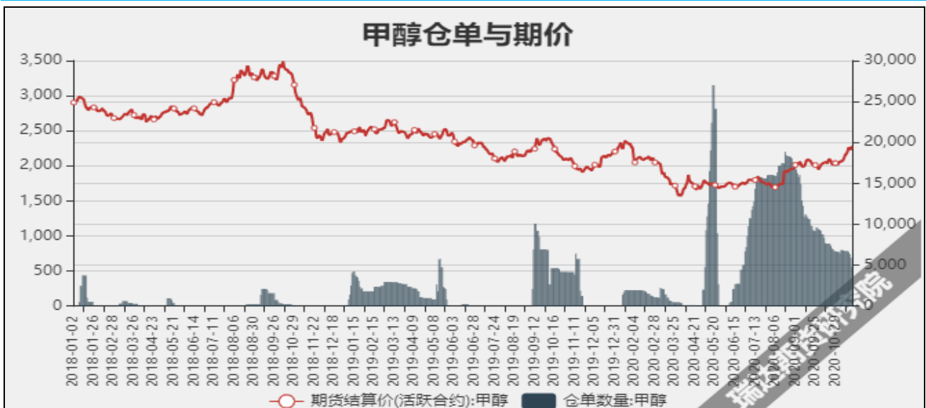
图7 甲醇期价与仓单数量