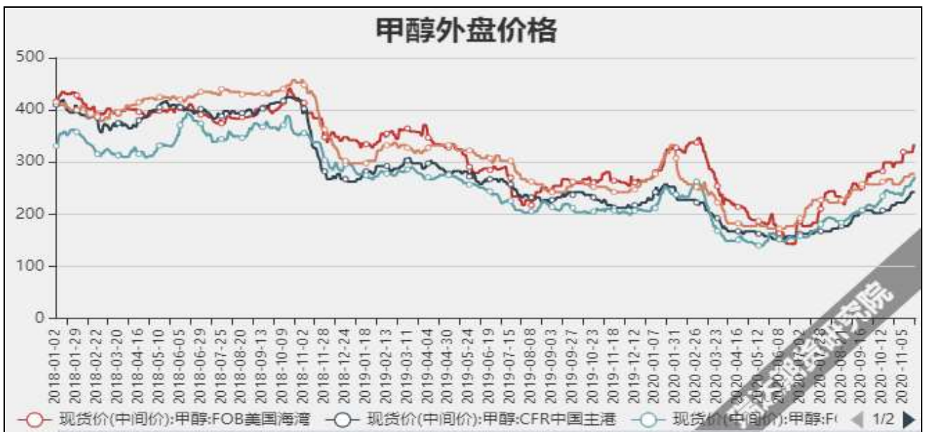
图5 外盘甲醇现货价格