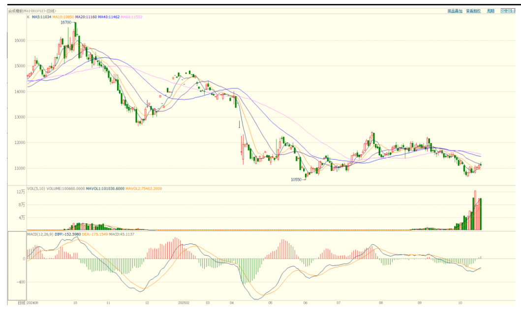
合成橡胶期货主力合约价格走势